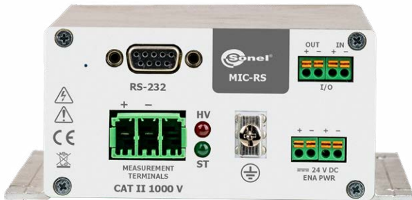
versión con interfaz RS-232